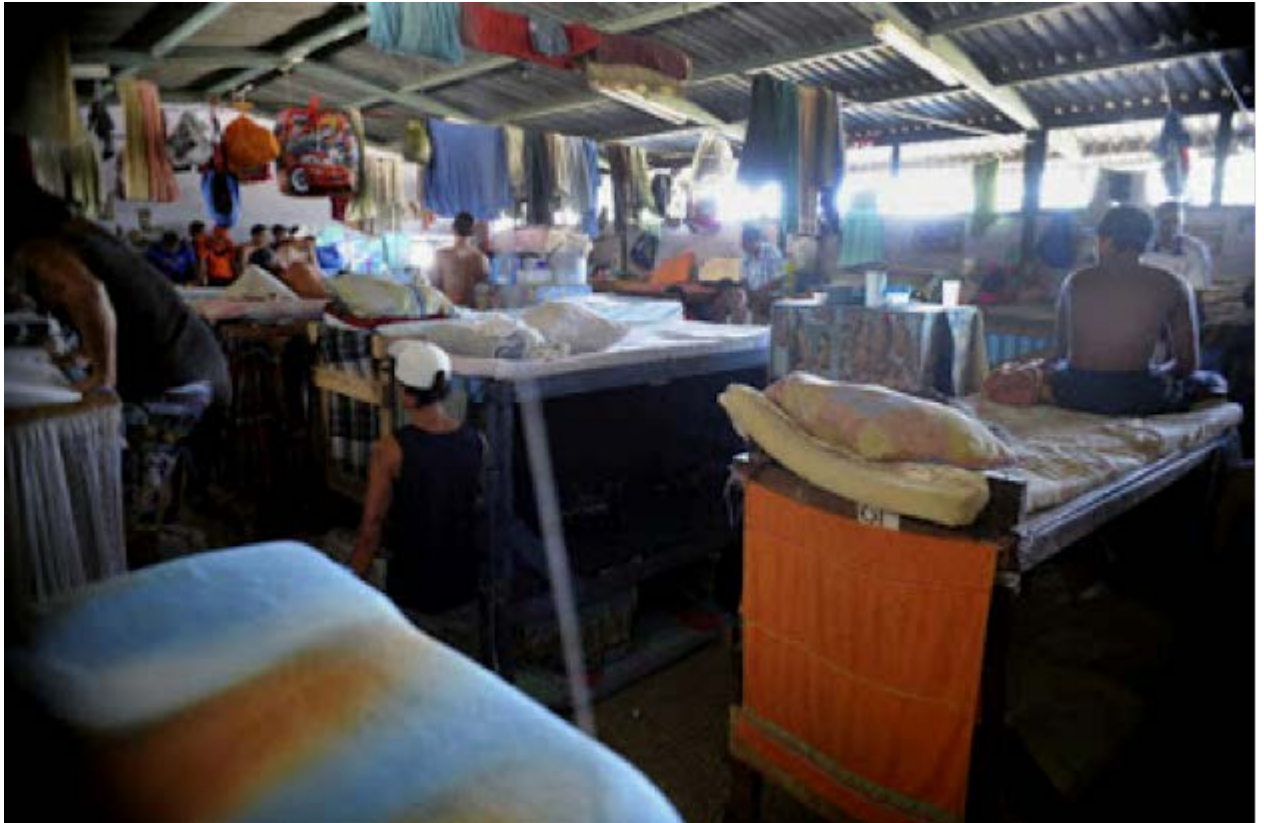
Foto extraída de artículo de prensa del 2015 titulado "Hacinamiento en cárceles alcanza cifra récord de 51%", La Nación (Costa Rica), 11 de marzo del 2015

“De acuerdo con el parámetro internacional, cualquier sistema de reclusión o prisión que trabaje bajo condiciones de hacinamiento superiores a 20 por ciento (es decir, 120 personas reclusas por 100 plazas disponibles) se encuentra en estado de “sobrepoblación crítica”. Una situación de “sobrepoblación crítica” puede generar violaciones o desconocimiento de los derechos fundamentales de los internos” (p. 3).